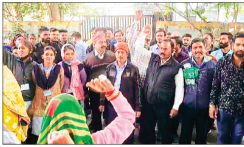
हरिभूमि न्यूज | सीहोर

बीच-बचाव करने वाले सैनिक व कर्मचारी भी घायल, दो आरोपी गिरफ्तार, एक फरार, कर्मचारियों ने दी काम बंद की चेतावनी